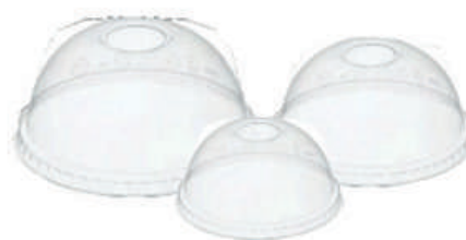
Tapas domo con perforación

8oz/10oz 9oz/12oz 16oz/20oz Caja por 1000 unid Caja por 1000 unid Caja por 1000 unid