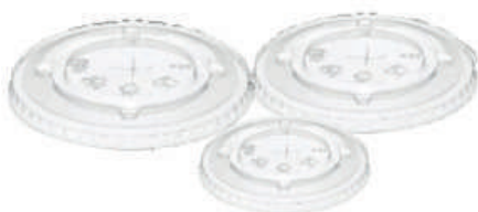
Tapas planas con perforación

8oz/10oz 9oz/12oz 16oz/20oz Caja por 1000 unid Caja por 1000 unid Caja por 1000 unid